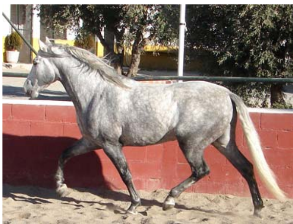
Schön war die Reise (Danke an Alle, die sie ermöglichten!), doch nun geht's weiter mit Ketama's Geschichte in der Schweiz!

Nach gut 5000km Spanien erreichten wir Anfangs Dezember wieder unseren Hof. Mitgebracht hatten wir für uns viele Eindrücke und eine Bestätigung mehr, dass Ketama durchaus dem direkten Vergleich mit in Spanien aufgewachsenen Gleichaltrigen standhalten kann.