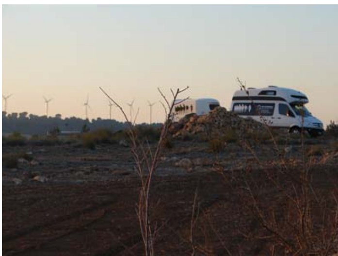
Eine der vielen Stationen Nähe Albacete