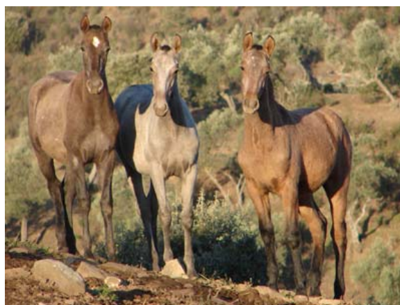
Absetzergruppe im Morgenlicht