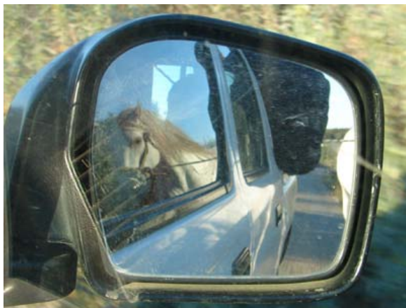
Artig hinter dem Jeep trotzend...

Die grosse Stutenherde lebt einige Kilometer weit vom Hof entfernt und es gab rossige Stuten, die belegt werden sollten. Da brauchts zwei Personen und einen alten Pickup, der Eine setzt sich ans Steuer, der Andere auf die Ladefläche, den Strick des ausgewählten Hengstes in der Hand und los geht's! Ueber Stock und Stein trabt der Hengst brav hinter dem Pickup her, und rein geht's in die Damengruppe.