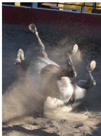
Ketama genießt kleine Freiheiten während der langen Reise...