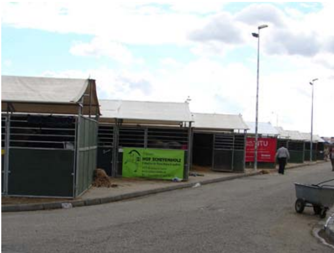
Box Nr 530 ist belegt, der „Zimmernachbar“ wird begrüßt und das Lager auf dem Truckerparkplatz aufgeschlagen...

Uebernachtung bei einem befreundeten Züchter und weiter nach Toledo, wo ein Ruhetag eingeplant war, so dass wir am Sonntag, 18.11. Sevilla erreichten. Wie immer kommen sehr viele der fast 800 ausgestellten Pferde erst sehr kurz vor Beginn am Dienstag, das einchecken am Sonntag war sehr gemütlich, Ketama gefiel seine Box und wir konnten uns auf dem Truckerparkplatz häuslich einrichten.