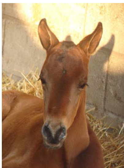
Eben geborener, kleiner Bruder des bekannten MINERO...