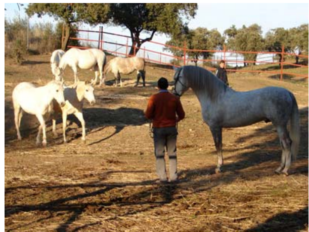
erwarten den edlen Herrn gleich zwei Damen...