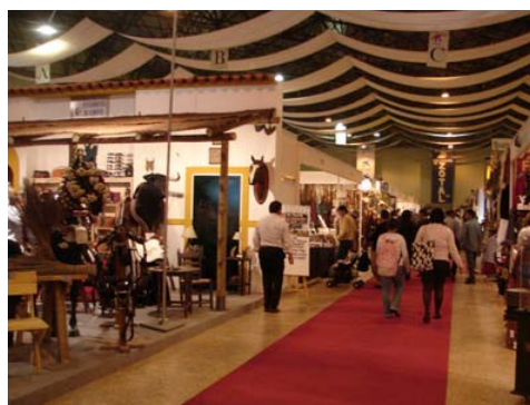
Die grosse Reitbahn und die Halle der Stände der SICAB