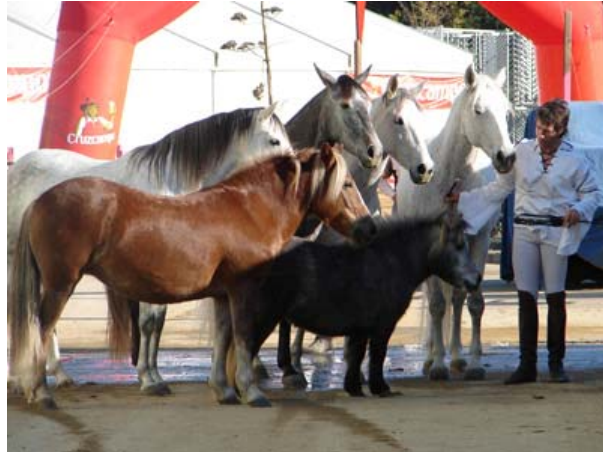
Schöne Bilder der SICAB...

Danach konnten wir es ruhiger angehen, diverse Sitzungen betreffend der Herdebuchführung mit den Verantwortlichen folgten, wir schauten uns viele der Präsentationen an und trafen uns mit Freunden aus Spanien und auch aus ganz Europa, die angereist kamen.