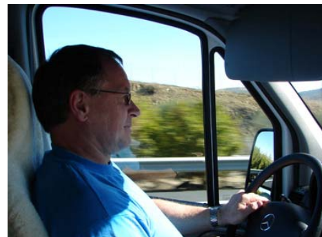
Der „Camepon de kilometros“