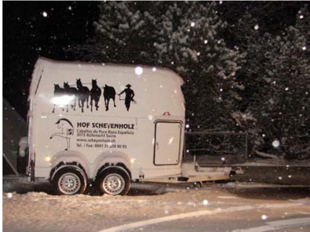
Garstiger Start um vier Uhr früh...