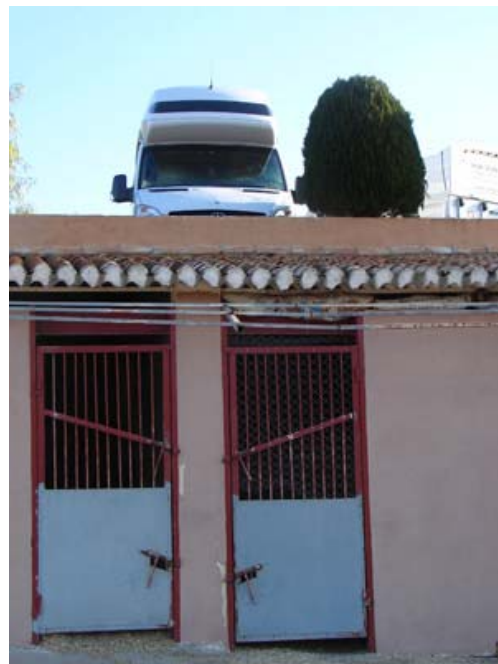
Finca in Montoro, Schlafplatz Pferd unten, Menschen oben...