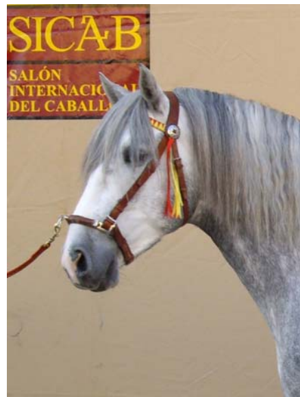
Ketama in Sevilla...

Eigentlich viel, aber so eine Teilnahme ist etwas Einmaliges und bietet uns stets die Möglichkeit, unzählige Kontakte zu pflegen. Nach Flamenco (2002) und Tarifa (2004) war dies unsere dritte Qualifikation und Teilnahme.