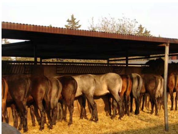
Absetzer in Cartagena...