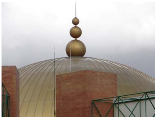
Die „heilige“ Kuppel des Palacio de Congresos in Sevilla, der Treffpunkt schlechthin für alle PRE-Freunde im November...

Die SICAB, der Salon Internacional del Caballo ist unter Anderem der Final der Zuchtschauen in Spanien, der jährlich im November im Palacio de Congresos in Sevilla stattfindet. Um sich da anmelden zu können, muss sich ein Tier im gleichen Jahr an einer anerkannten Zuchtschau qualifiziert haben. Ketama war im Juni Zweiter bei den Dreijährigen Hengsten in Jaen und somit qualifiziert. Was liegt da näher, als nach Sevilla zu fahren?