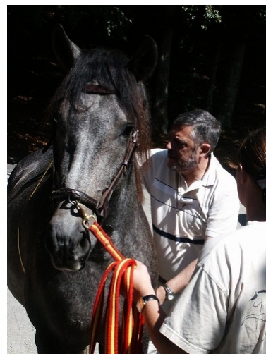
Ligero's Rumpumfang wird gemessen