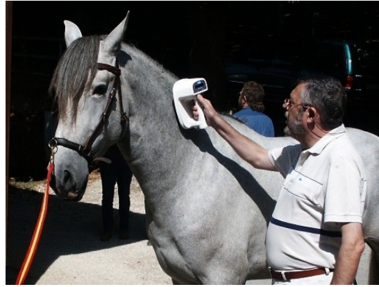
Kontrolle des Microchip (links Ligeró, rechts Orión)

Die drei vorgestellten Pferde aus unserer Nachzucht wurden zur Zucht aufgenommen: Orion, Ligeró und Tarifa, alle dreijährig. Ebenso drei weitere externe Pferde, Nadal-B1 (siebenjährig), Mistral (viereinhalb jährig) und Sorpresa (viereinhalb jährig).