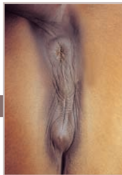
Wenig ausgebildet: die Scheide.